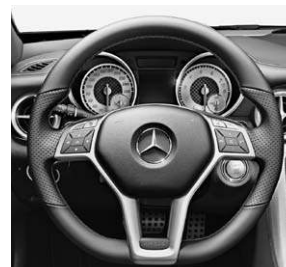
Multifunktions-Sportlenkrad mit Perforation und roter Ziernaht