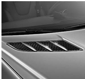
Finnenaufsätze für die Motorhaube