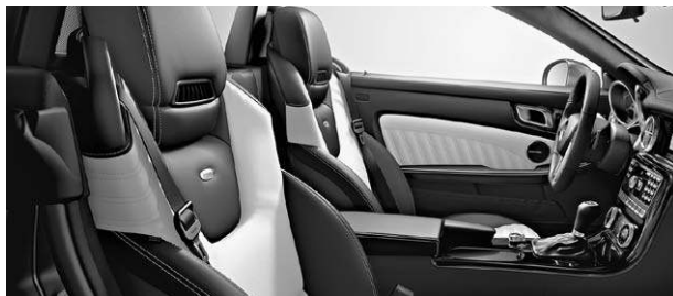
designo Leder Exklusiv zweifarbig