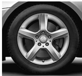
40,6 cm (16") Leichtmetallrad im 5-Speichen-Design (R19)