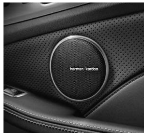
Harman Kardon® Logic7® Surround-Soundsystem