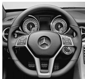
Multifunktionslenkrad im 3-Sp.-Design, unten abgeflacht