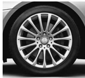
43,2 cm (17") Leichtmetallrad im Vielspeichen-Design (R81)