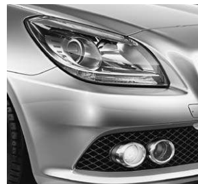
Klarglas-Scheinwerfer, Tagfahrlicht und Nebelscheinwerfer