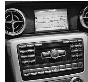
Becker® MAP PILOT für Audio 20 CD