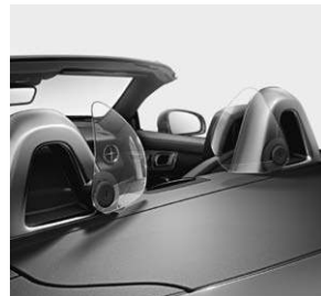
AIRGUIDE und Überrollbügel mit Einleger Aluminium eloxiert