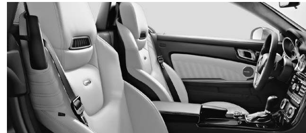
designo Leder Exklusiv einfarbig