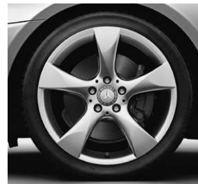
45,7 cm (18") Leichtmetallrad im 5-Speichen-Design (R32)