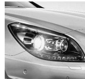
Scheinwerfer mit dunkler Einfassung