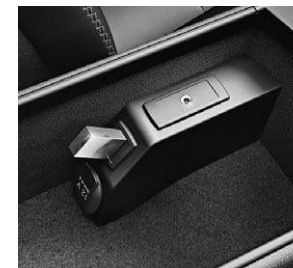
USB-Schnittstelle und AUX-IN- Anschluss in der Mittelkonsole