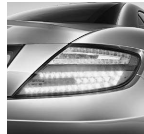
Heckleuchten in LED-Technik