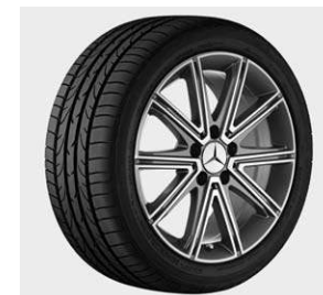
10-Speichen-Design, Palladiumsilber, glanzgedreht