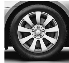
40,6 cm (16") Leichtmetallrad im 9-Speichen-Design (R12)