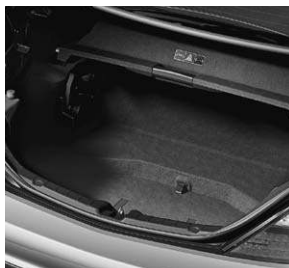
Kofferraum mit Wendeboden