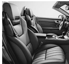
Sitze im spezifischen Längspfeifen-Design