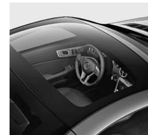
Panorama-Variodach mit MAGIC SKY CONTROL