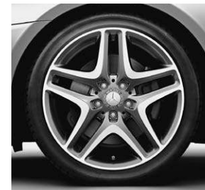
45,7 cm (18") Leichtmetallrad im 5-Doppelspeichen-Design (22R)