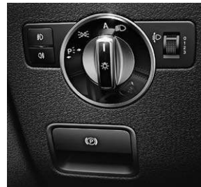
Feststellbremse elektrisch mit Komfortfunktion