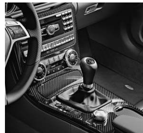
Zierelemente AMG Carbon