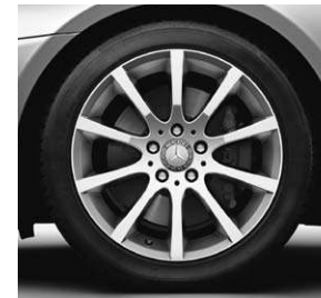
43,2 cm (17") Leichtmetallrad im 10-Speichen-Design (R35) (Serie SLK 350)