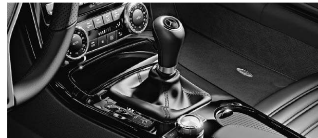
designo Zierelemente in Klavierlack schwarz