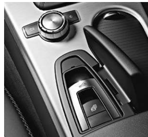
Dach-Bedieneinheit und zentrales Bedienelement