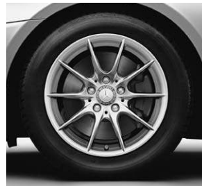
40,6 cm (16") Leichtmetallrad im 10-Speichen-Design (39R) (Serie SLK 200)