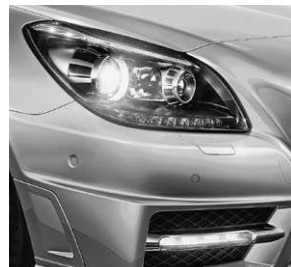
Intelligent Light System (Darstellung mit Sport-Paket AMG)