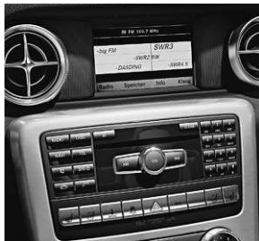
Audio 20 CD