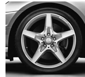
45,7 cm (18") AMG Leichtmetallrad im 5-Speichen-Design, glanzgedreht