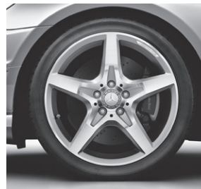
45,7 cm (18") AMG Leichtmetallrad im 5-Speichen-Design, glanzgedreht (782)