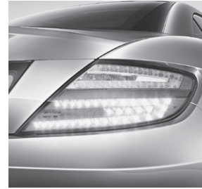
Heckleuchten in LED-Technik