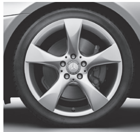
45,7 cm (18") Leichtmetallrad im 5-Speichen-Design (R32)