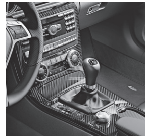
Zierelemente AMG Carbon (H73)