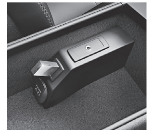
USB-Schnittstelle und AUX-IN- Anschluss in der Mittelkonsole