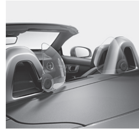
AIRGUIDE und Überrollbügel mit Einleger Aluminium eloxiert (283+B15)