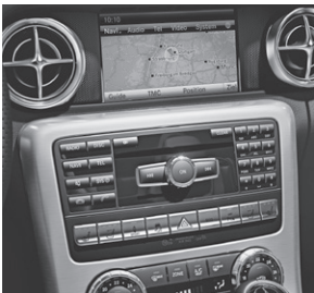
COMAND Online (427)