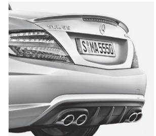
AMG Heckschürze, Abrisskante und Sport-Abgasanlage