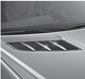
Finnenaufsätze für die Motorhaube