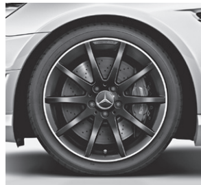
45,7 cm (18") AMG Leichtmetallrad im 10-Speichen-Design, Mattschwarz lackiert (760)