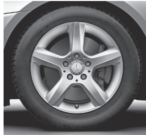
40,6 cm (16") Leichtmetallrad im 5-Speichen-Design (R19)