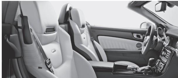
designo Leder Exklusiv einfarbig