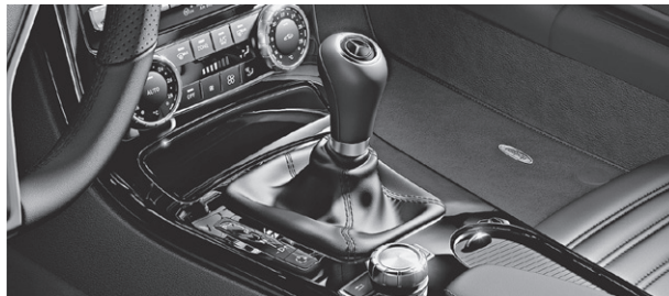
designo Zierelemente in Klavierlack schwarz (W69)