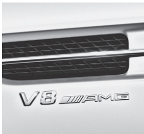
»V8 AMG« Schriftzug