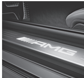
AMG Einstiegsleisten beleuchtet