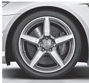
45,7 cm (18") AMG Leichtmetallrad im 5-Speichen-Design (790)