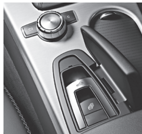
Dach-Bedieneinheit und zentrales Bedienelement