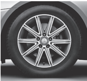
43,2 cm (17") Leichtmetallrad im 10-Speichen-Design (R93)