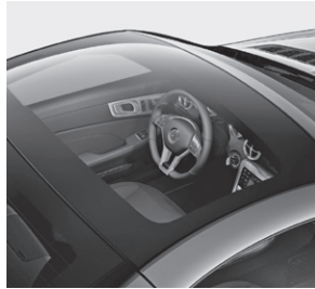
Panorama-Variodach mit MAGIC SKY CONTROL (412)