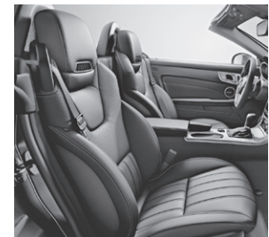
Sitze im spezifischen Längspfeifen-Design