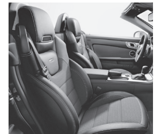
AMG Sportsitze mit Ledernachbildung ARTICO/Stoff schwarz (701A)