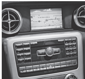
Becker® MAP PILOT für Audio 20 CD (509)