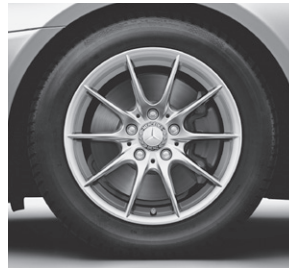
40,6 cm (16") Leichtmetallrad im 10-Speichen-Design (39R) (Serie SLK 200)