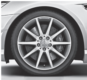
45,7 cm (18") AMG Leichtmetallrad im 10-Speichen-Design, Titangrau lackiert (796)