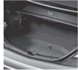
Kofferraum mit Wendeboden