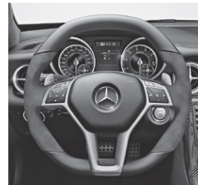
AMG Performance Lenkrad in Leder Nappa/Mikrofaser DINAMICA (281)