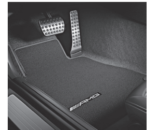
AMG Fußmatten (U26)