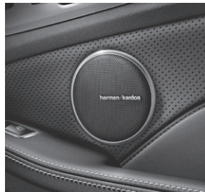
Harman Kardon® Logic7® Surround-Soundsystem (810)