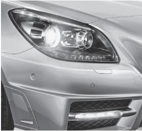
Intelligent Light System (Darstellung mit Sport-Paket AMG) (622)