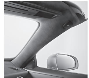
designo Scheibenrahmen Mikrofaser DINAMICA (Y41)