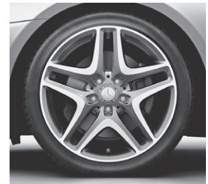
45,7 cm (18") Leichtmetallrad im 5-Doppelspeichen-Design (22R)