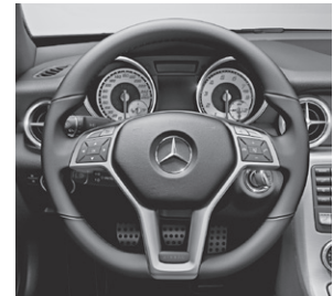
Multifunktionslenkrad im 3-Sp.-Design, unten abgeflacht