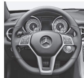
Multifunktions-Sportlenkrad mit Perforation und roter Ziernaht