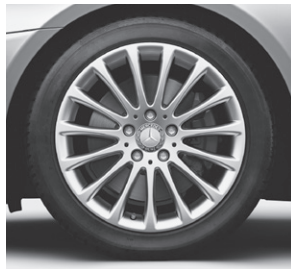
43,2 cm (17") Leichtmetallrad im Vielspeichen-Design (R81)