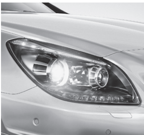
Scheinwerfer mit dunkler Einfassung