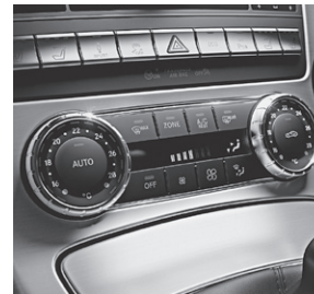
Klimaanlage THERMOTRONIC (581)