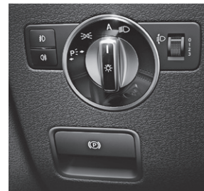
Feststellbremse elektrisch mit Komfortfunktion