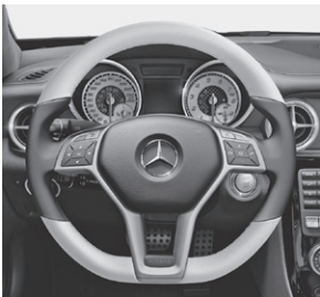
designo Lederlenkrad zweifarbig (Y96)