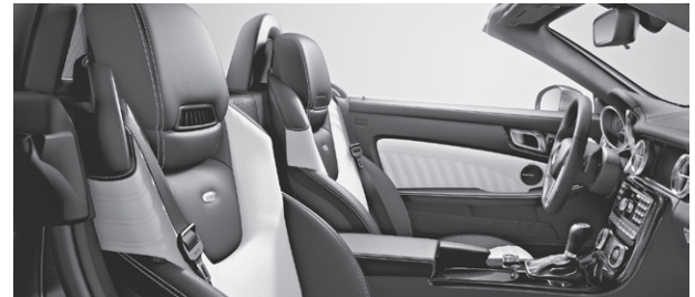
designo Leder Exklusiv zweifarbig