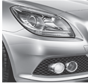
Klarglas-Scheinwerfer; Tagfahrlicht und Nebelscheinwerfer (257)