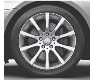
43,2 cm (17") Leichtmetallrad im 10-Speichen-Design (R35)