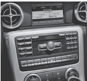
Audio 20 CD (523)