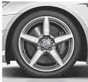
45,7 cm (18") AMG Leichtmetallrad im 5-Speichen-Design (790)