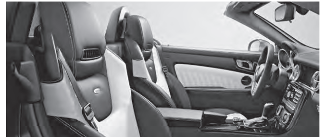
designo Leder Exklusiv zweifarbig