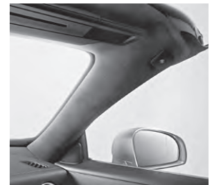
designo Scheibenrahmen Mikrofaser DINAMICA (Y41)