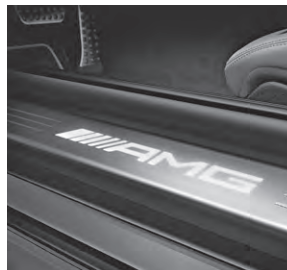
AMG Einstiegsleisten beleuchtet