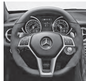
AMG Performance Lenkrad in Leder Nappa schwarz/Alcantara® (281)