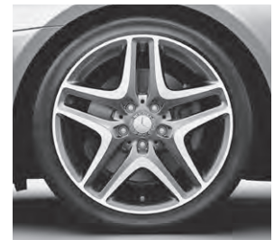
45,7 cm (18") Leichtmetallrad im 5-Doppelspeichen-Design (22R)