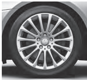
43,2 cm (17") Leichtmetallrad im Vielspeichen-Design (R81)