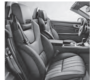
Sitze im spezifischen Längspfeifen-Design