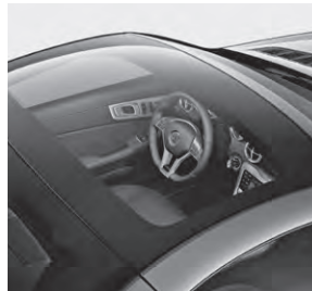
Panorama-Variodach mit MAGIC SKY CONTROL (412)