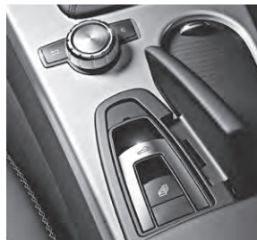
Dach-Bedieneinheit und zentrales Bedienelement