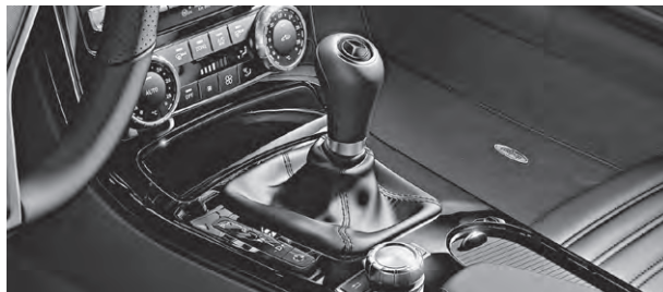
designo Zierelemente in Klavierlack schwarz (W69)