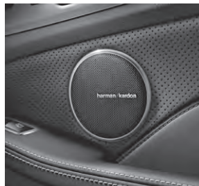
Harman Kardon® Logic7® Surround-Soundsystem (810)