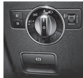
Feststellbremse elektrisch mit Komfortfunktion