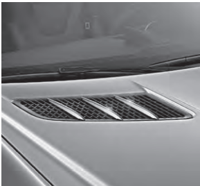
Finnenaufsätze für die Motorhaube