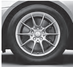
40,6 cm (16") Leichtmetallrad im 10-Speichen-Design (39R) (Serie SLK 200)