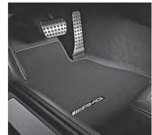
AMG Fußmatten (U26)