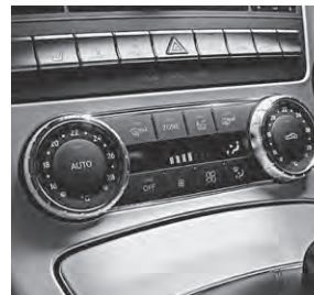
Klimaanlage THERMOTRONIC (581)