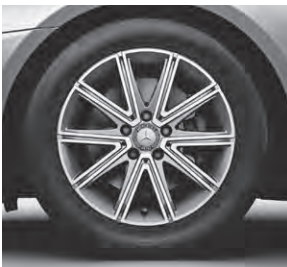
43,2 cm (17") Leichtmetallrad im 10-Speichen-Design (R93)