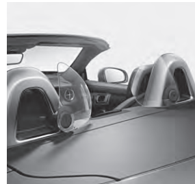
AIRGUIDE und Überrollbügel mit Einleger Aluminium eloxiert (283+B15)