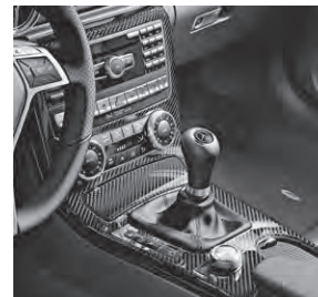
Zierelemente AMG Carbon (H73)