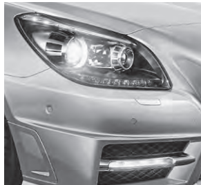
Intelligent Light System (Darstellung mit Sport-Paket AMG) (622)