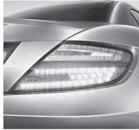
Heckleuchten in LED-Technik