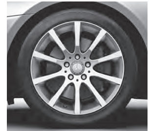
43,2 cm (17") Leichtmetallrad im 10-Speichen-Design (R35)