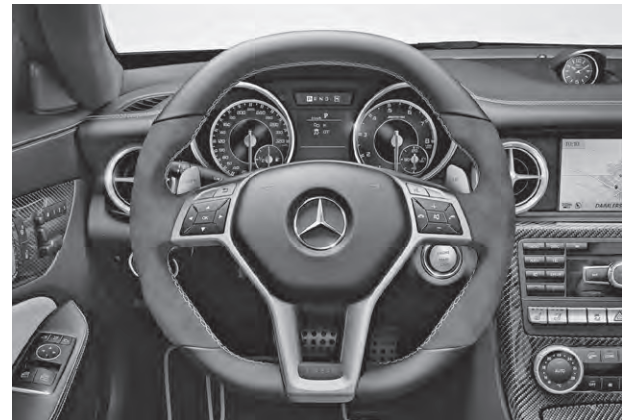
AMG Performance Lenkrad in Leder Nappa schwarz/Alcantara® (281), AMG Zierelemente Carbon (H73)