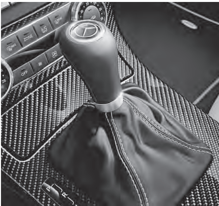
Wählhebel inklusive Schaltbalg in Leder Nappa mit Kontrastziernähten in platinweiß