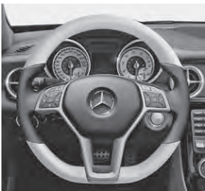
designo Lederlenkrad zweifarbig (Y96)