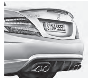
AMG Heckschürze, Abrisskante und Sport-Abgasanlage