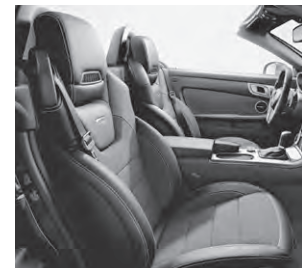
AMG Sportsitze mit Ledernachbildung ARTICO/Stoff schwarz (701A)