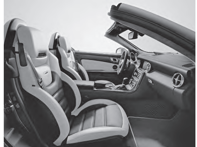
designo Leder Exklusiv zweifarbig platinweiß pearl/schwarz (X88)