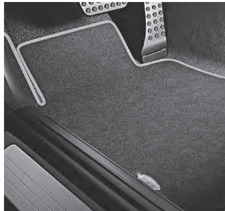
designo Fußmatten Velours schwarz mit Ledereinfassung in platinweiß pearl