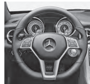
Multifunktions-Sportlenkrad mit Perforation und roter Ziernaht