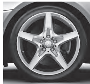
45,7 cm (18") AMG Leichtmetallrad im 5-Speichen-Design (782)