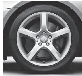
43,2 cm (17") Leichtmetallrad im 5-Speichen-Design (37R)