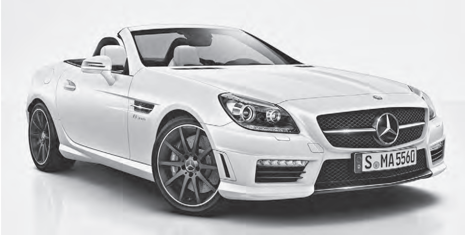
designo Lack magno kaschmirweiß (049), 45,7 cm (18") AMG Leichtmetallräder im 10-Speichen-Design mattschwarz lackiert (760)