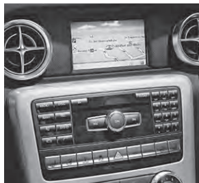
Becker® MAP PILOT für Audio 20 CD (509)