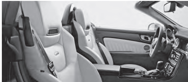
designo Leder Exklusiv einfarbig