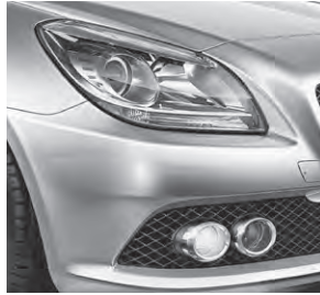
Klarglas-Scheinwerfer; Tagfahrlicht und Nebelscheinwerfer (257)