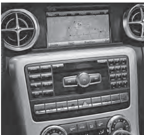
COMAND Online (427)