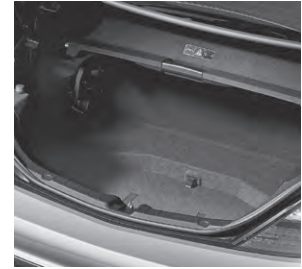
Kofferraum mit Wendeboden