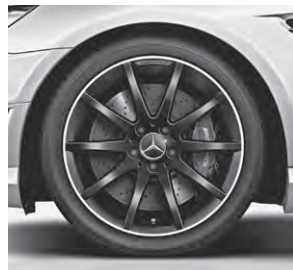
45,7 cm (18") AMG Leichtmetallrad im 10-Speichen-Design, Mattschwarz lackiert (760)