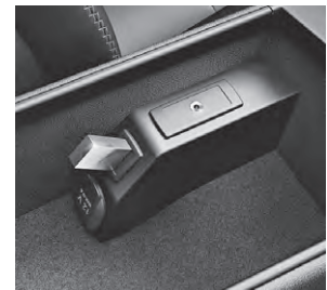
USB-Schnittstelle und AUX-IN- Anschluss in der Mittelkonsole