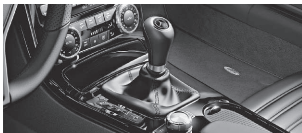
designo Zierelemente in Klavierlack schwarz